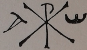
FIG. 6.—Fragmento superior de la losa sepulcral de Bonifatia , de Mérida, de los años 400 al 440. Según la reproducción del P. Fita.

BONIFATIA CON LVN X SILVANO VIXIT AN NIS XV III RECEPTA IN P ACE DIA EIUS FEBR VARTAS IN NOMINE