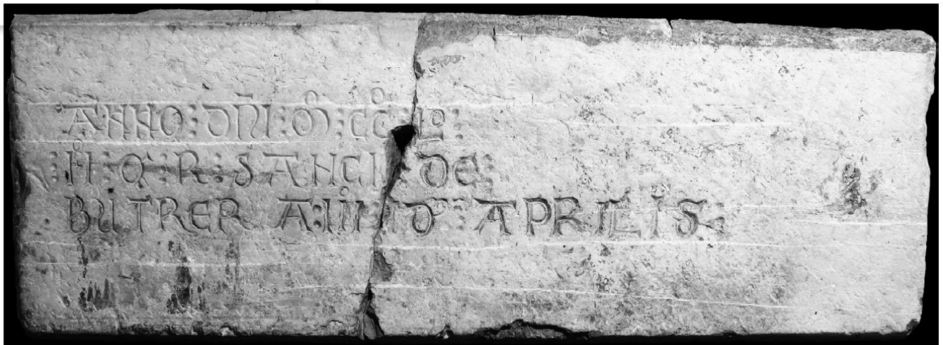
Captura de pantalla 2025-12-210422