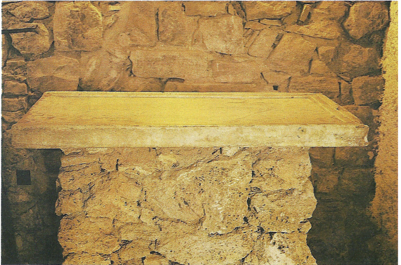
Sant Feliu del Racó