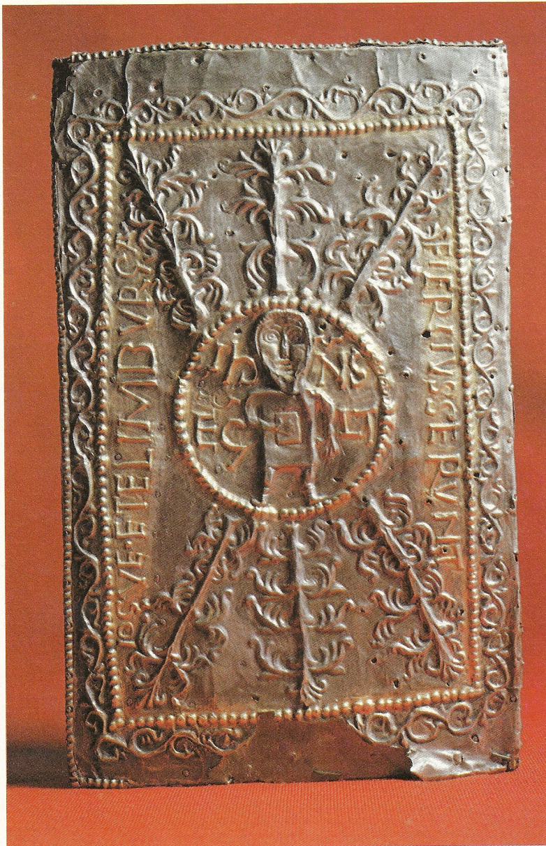
Sant Pere de Rodes. Ara d'altar portàtil procedent del monestir i actualment al Museu d'Art de Girona, inventariada amb el núm. 17. Revers

es troben al Museu Municipal de Figueres i al Museu Frederic Marès, de Barcelona.