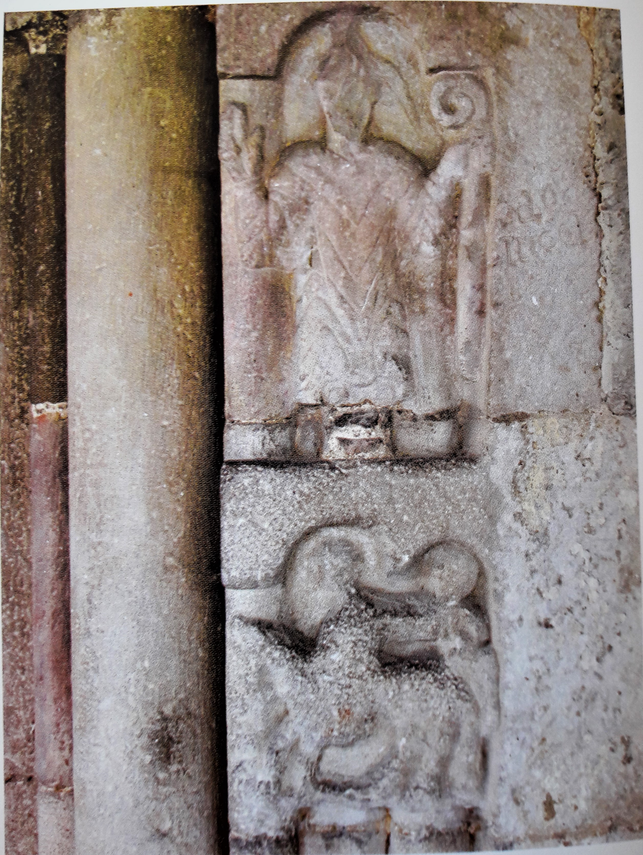
Relieves de la portada