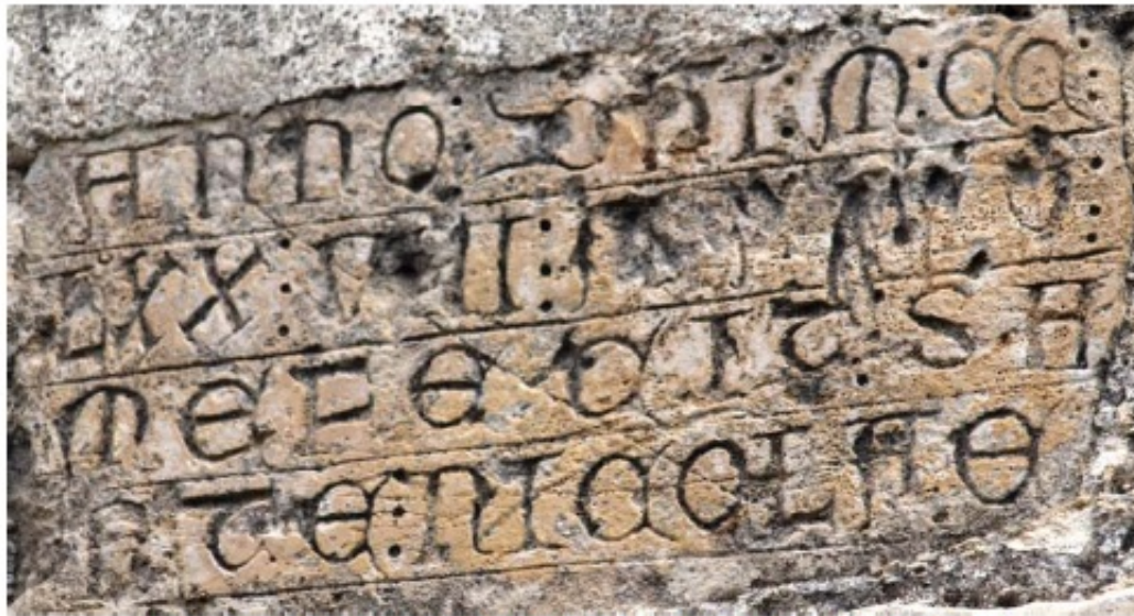
l. a. Roboratio de la iglesia de San Nicolás de Bari. Arroyuelo (Ap. n.º 168)