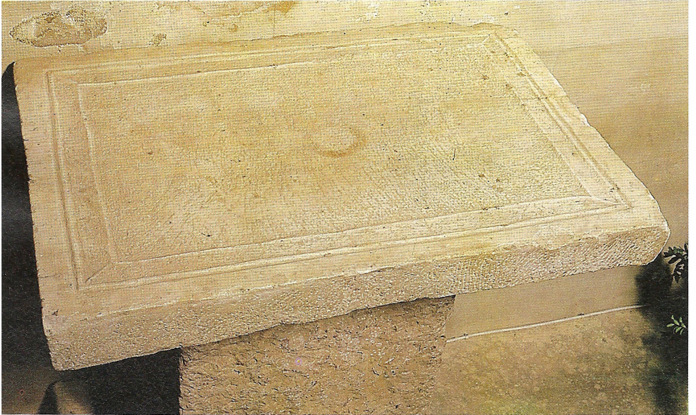
Sant Martí d'Empúries ara paleocristiana