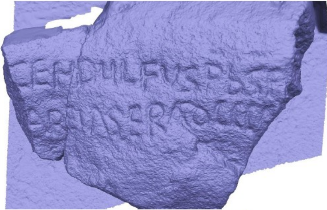
Imagen CO3. Modelo generado con Agisoft Metashape.