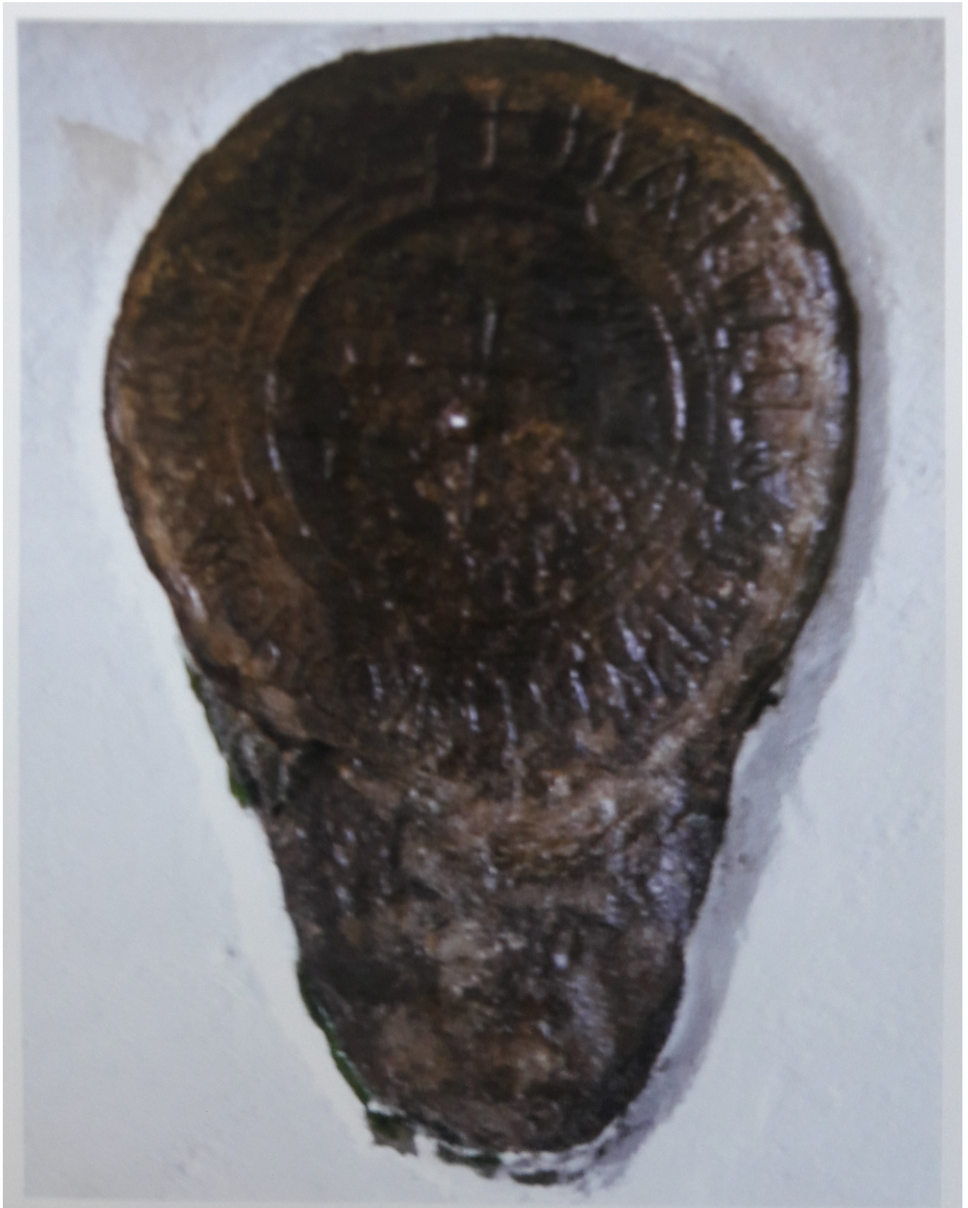
Epitafio de Santa María de Bullaso