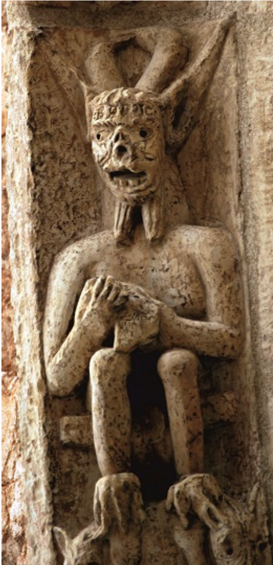
028b LAM XXb