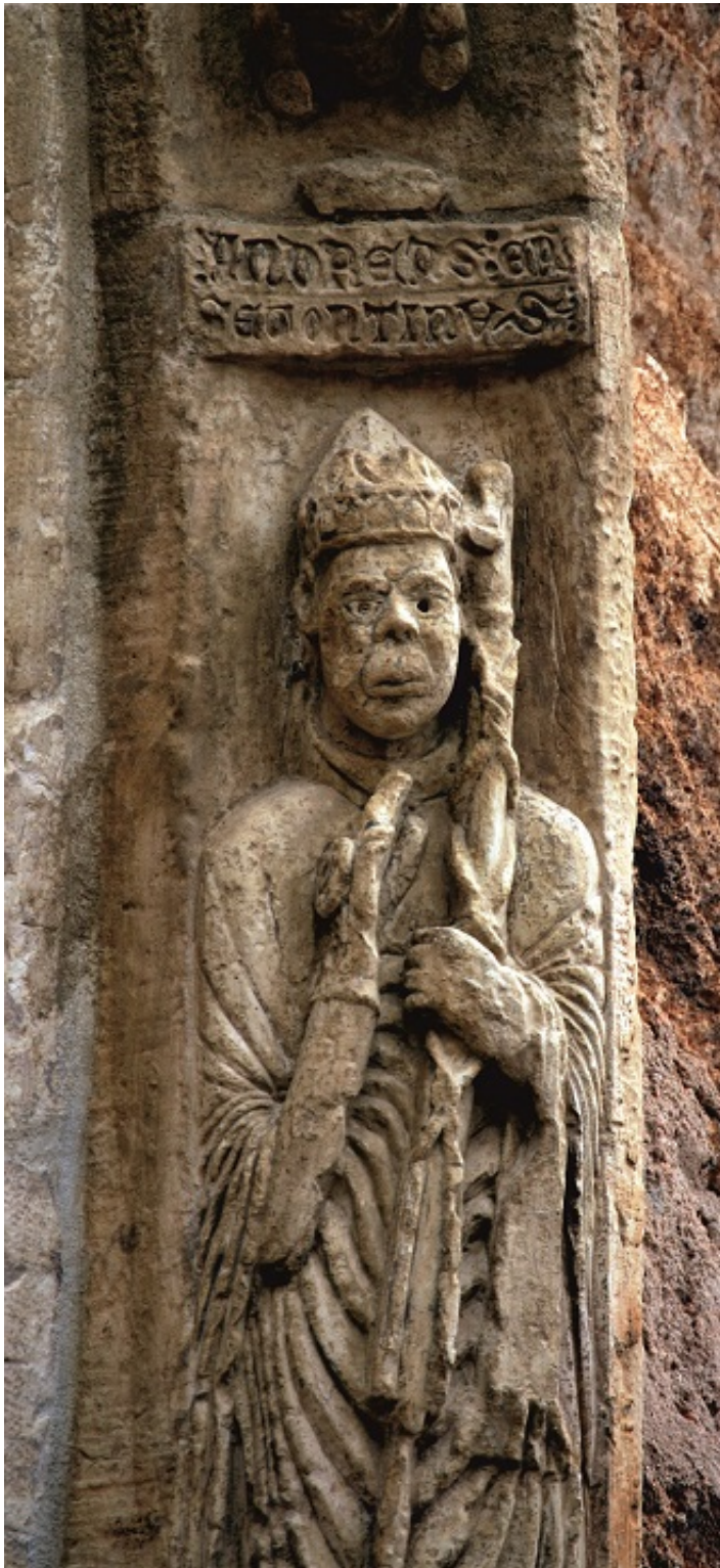
028a LAM XXa XL