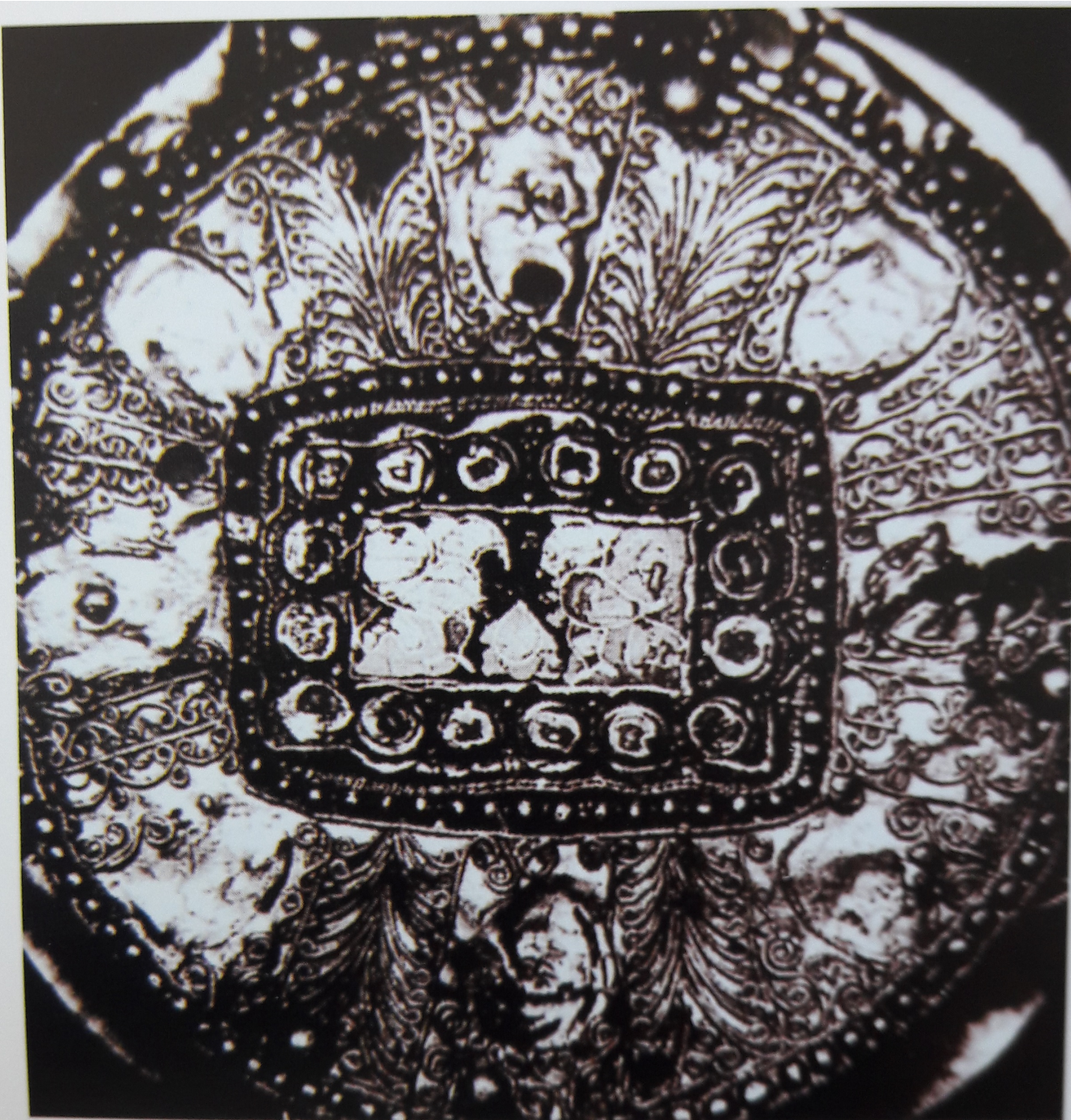
Detalle del engarce central