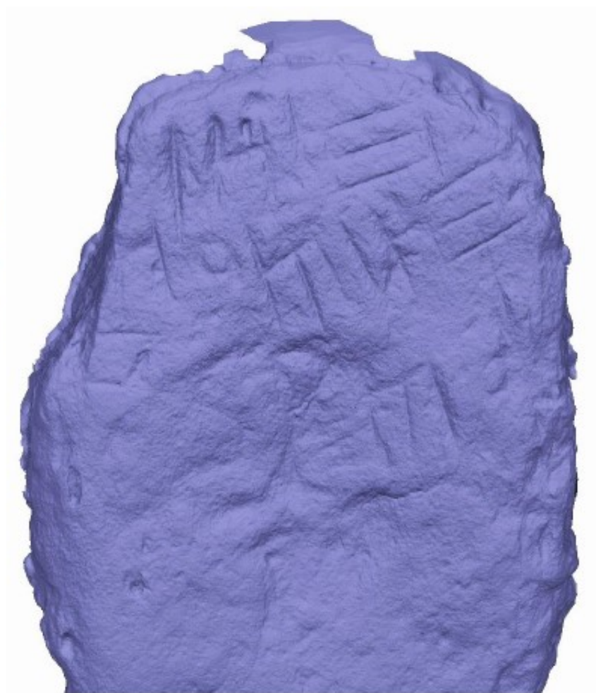
Imagen V4. Dcha. modelo generado con Agisoft Metashape.