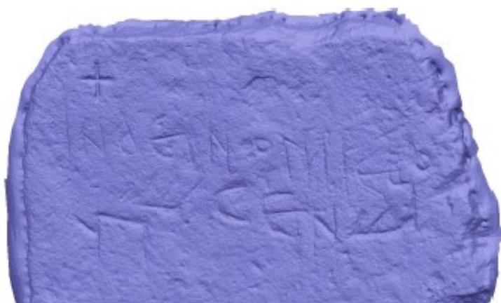
Imagen V8. Modelo generado con Agisoft Metashape.