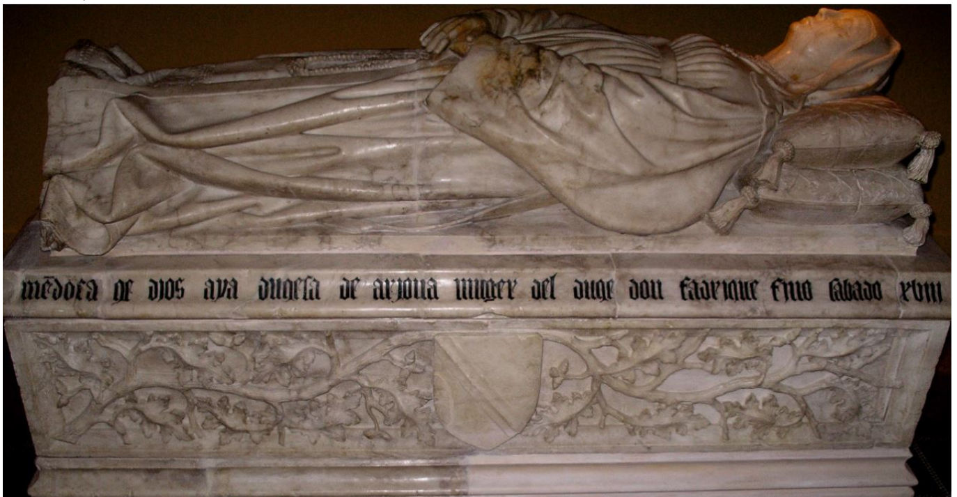
CIHM 4, 56a2