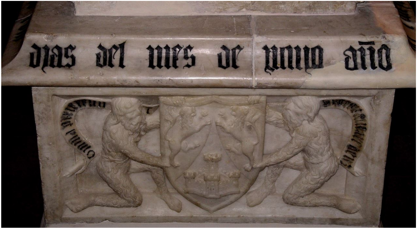
CIHM 4, 56c