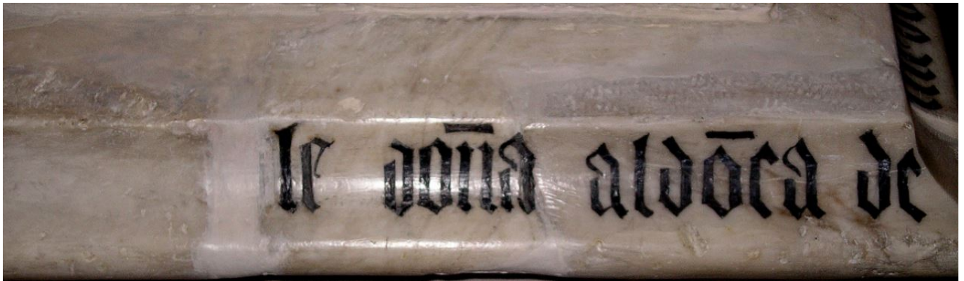
CIHM 4, 56a1