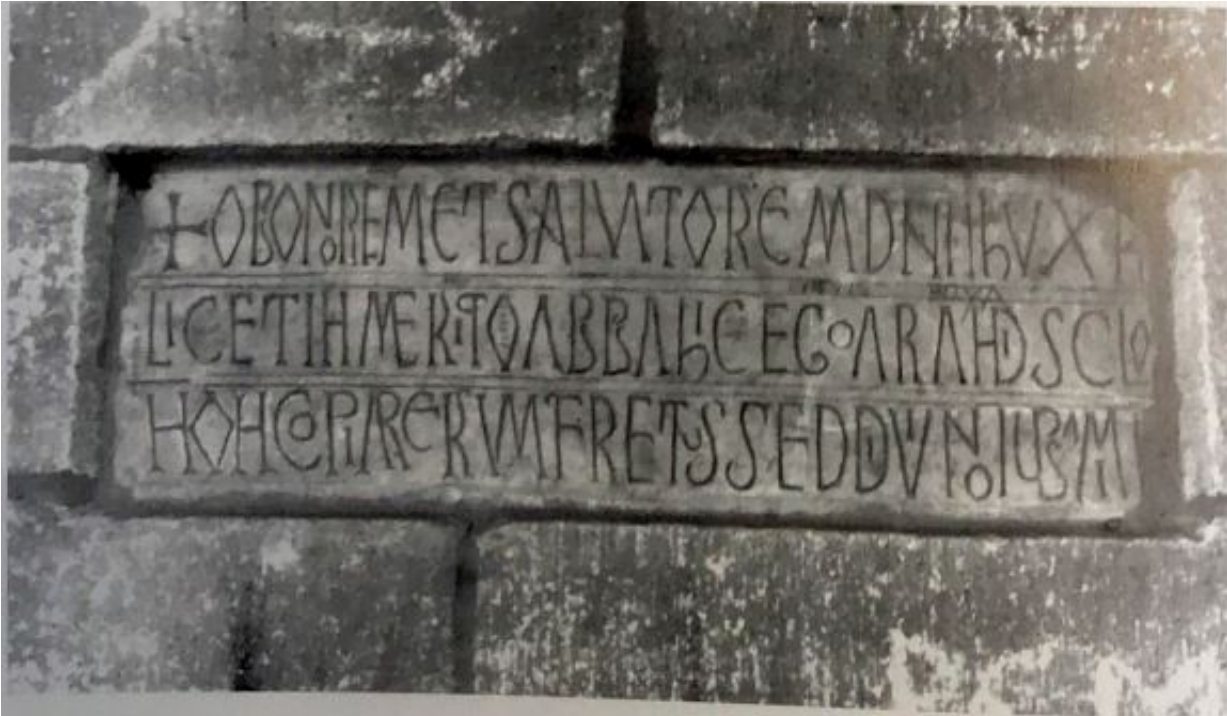
B: Inscripción n.º 5