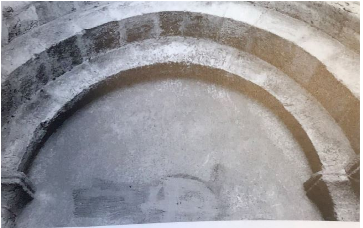
B: Inscripción n.º 21