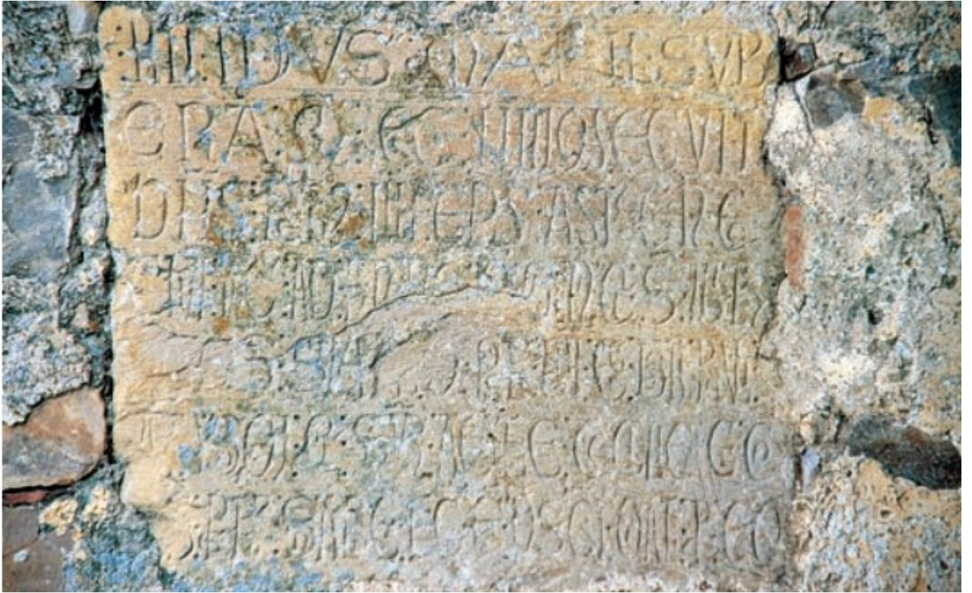
Captura de pantalla 2023-05-112309