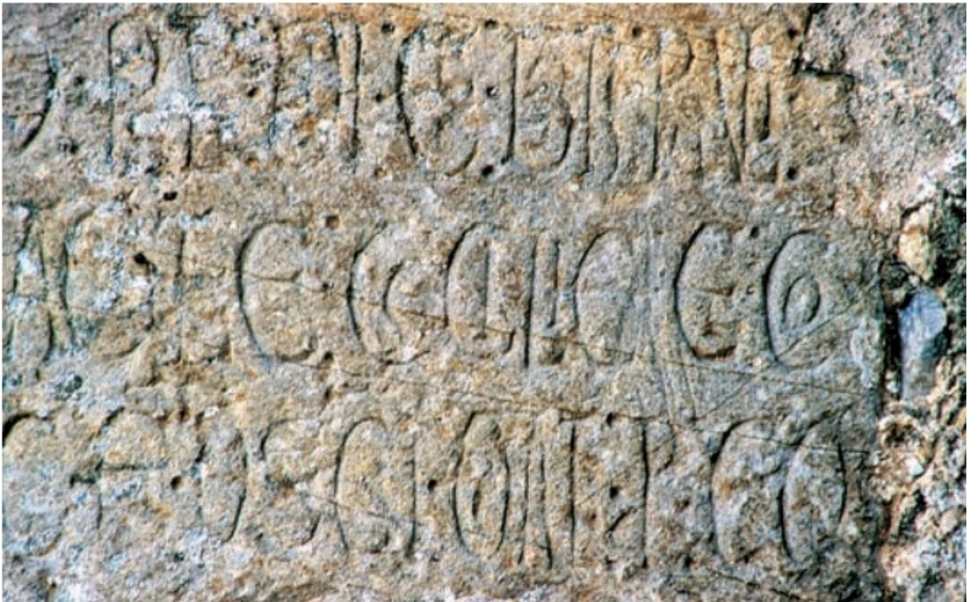
Captura de pantalla 2023-05-112321