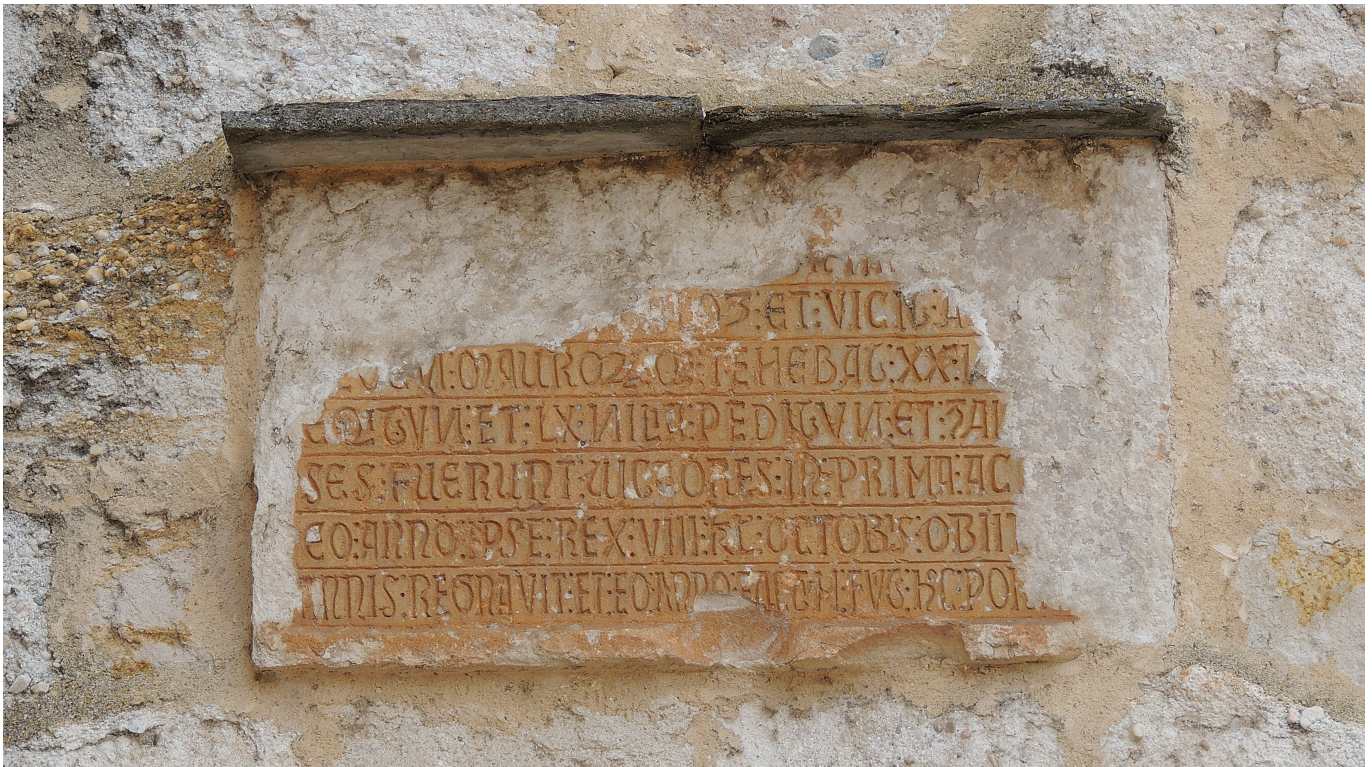
Zamora - Puerta del Obispo -Lápida-