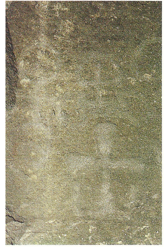
Roca del Passarell