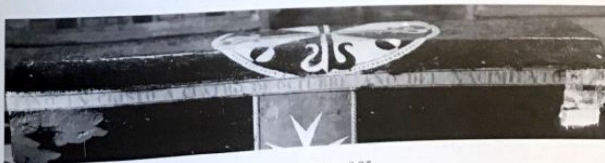
B: Inscripción n.º 85