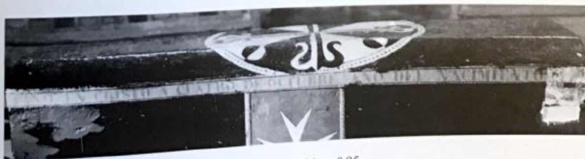
B: Inscripción n.º 85