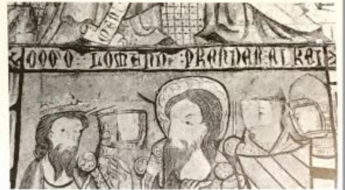
Inscripción n.º 96 (Continuación)