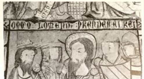
Inscripción n.º 96 (Continuación)