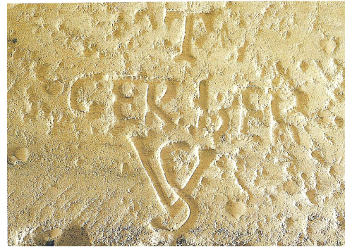
MIRO MAURICII MARTINUS GERBERTUS