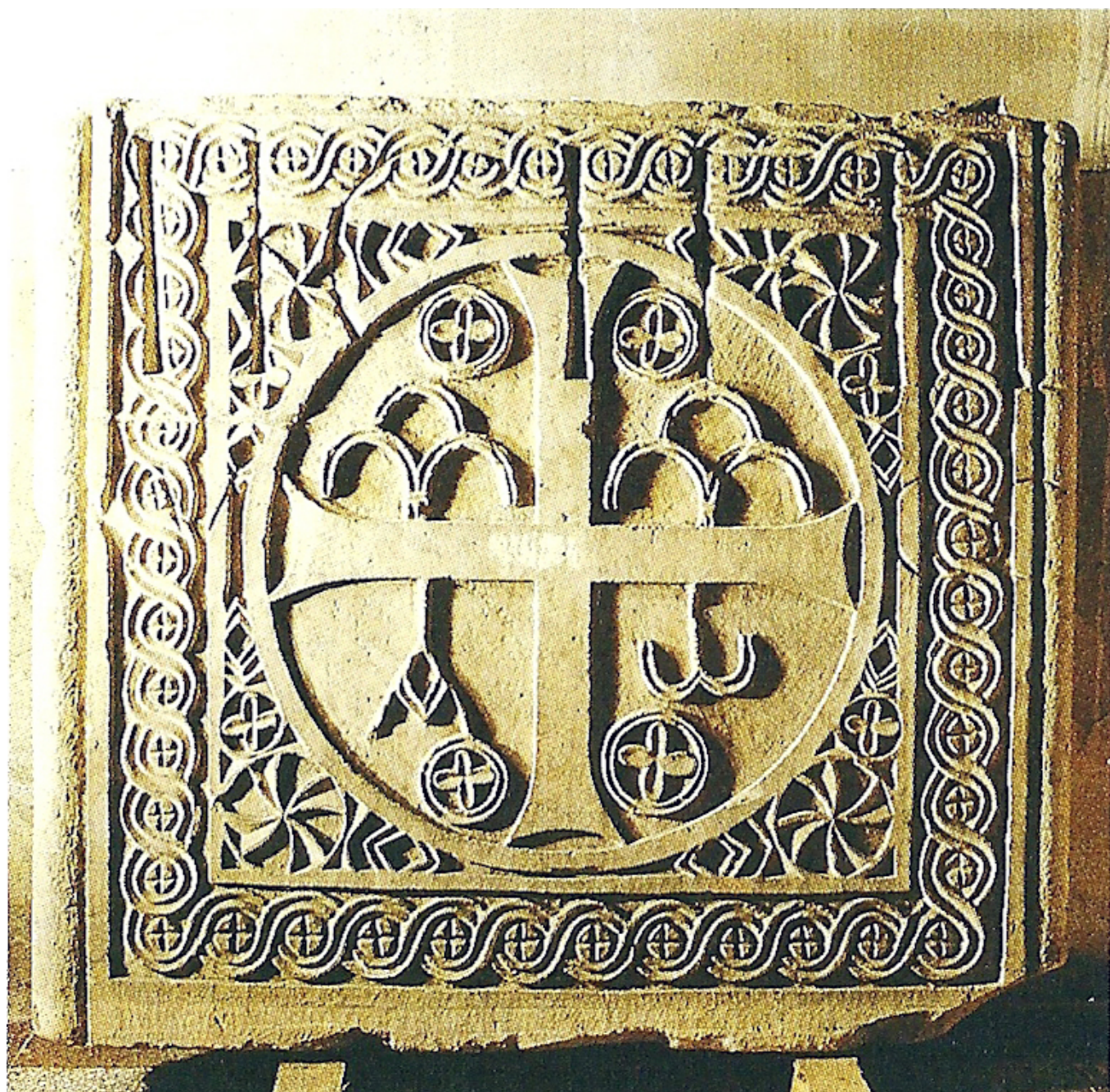
Sant Sadurní de Noya de la Ribera placa de cancel