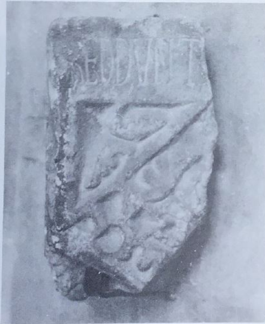
2. Inscripción 4 (Museo Arqueológico Provincial. León).