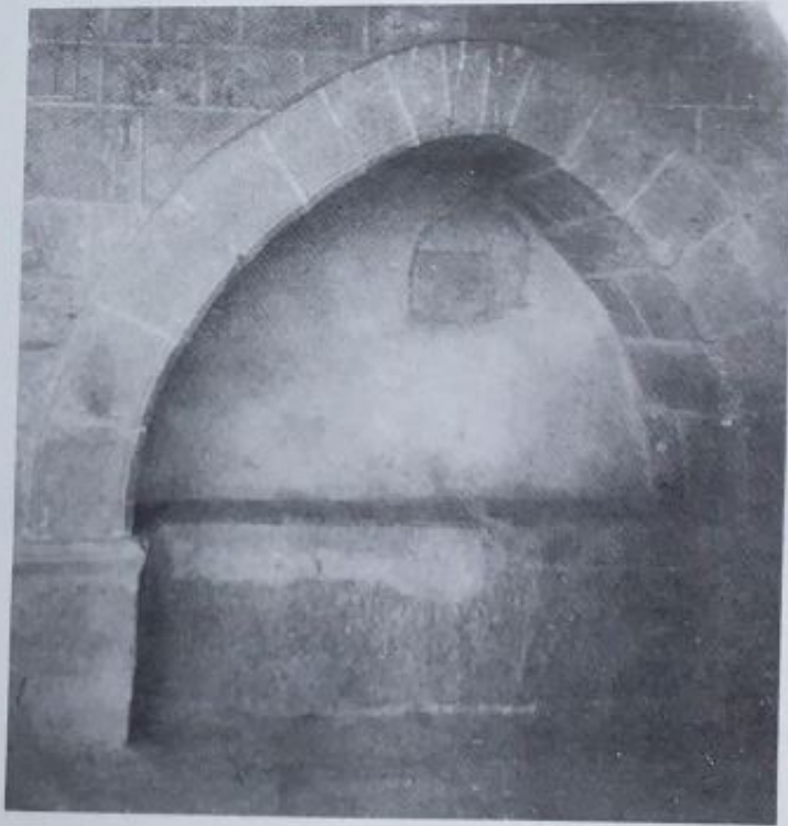
2. Arco y sepulcro en cuya cubierta se trazó la inscripción 26. Al fondo de la pared, la inscripción 27.