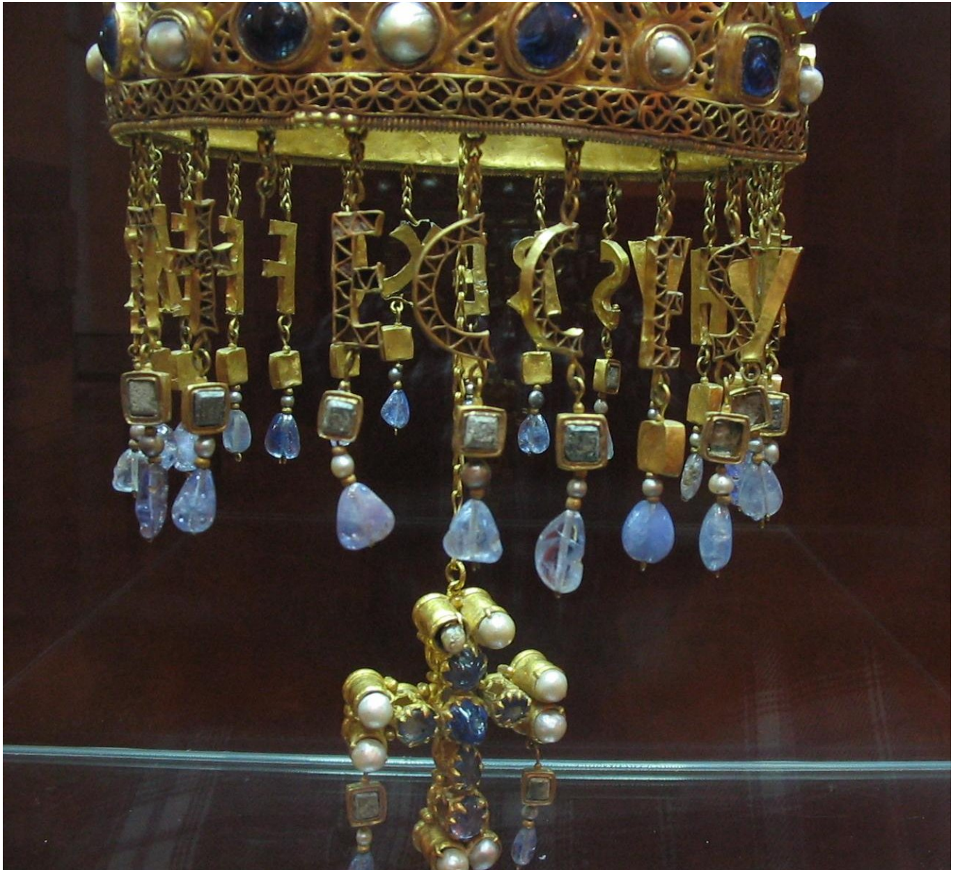
Tesoro de Guarrazar -M.A.N. Madrid- 01b