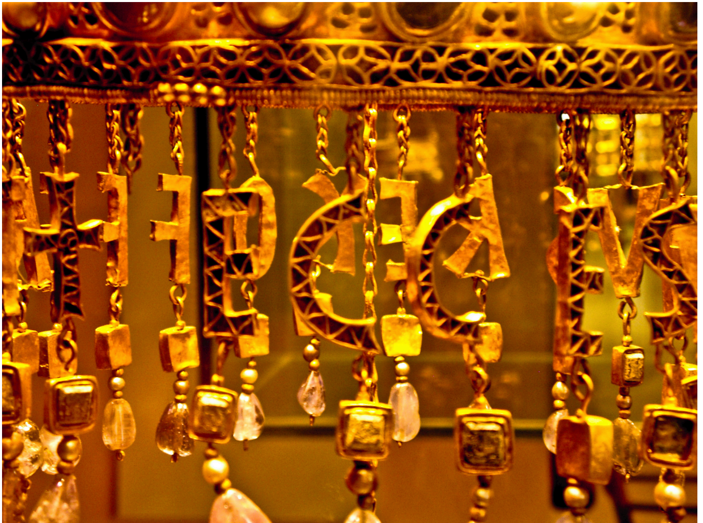
Corona votiva Recesvinto