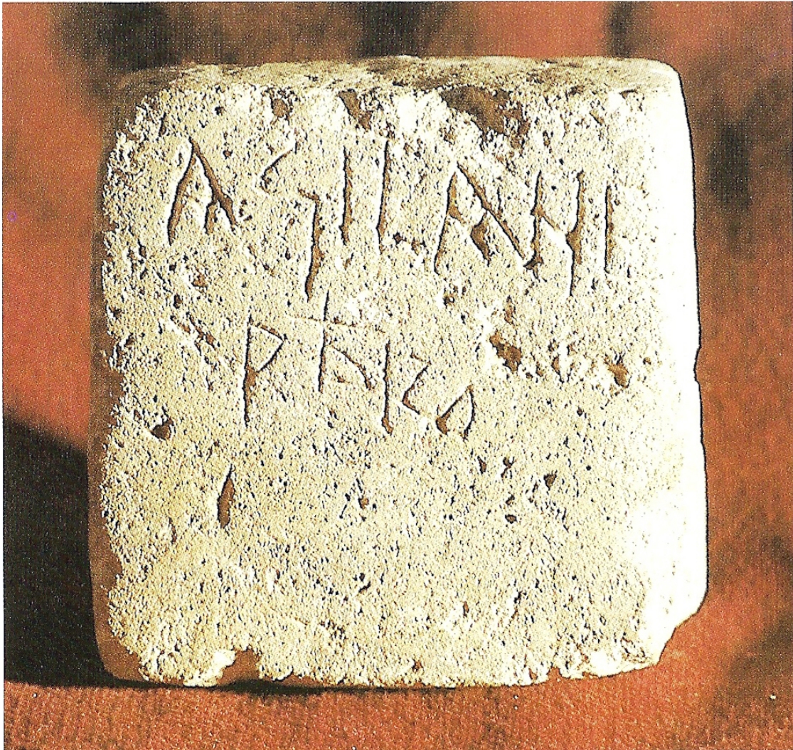
ΑΓΙΛΑΝΕ Π[ΡΕΣ]Β[ΥΤΕ]ΡΟ (Αγίλα, πρεβερε) ι α λα cara oposada: ΡΙΧΙΛΙΟΝΕ/ΤΡΑΣΕΜΙ/ΡΟ (Ρικίλο, Τρασεμίρ).