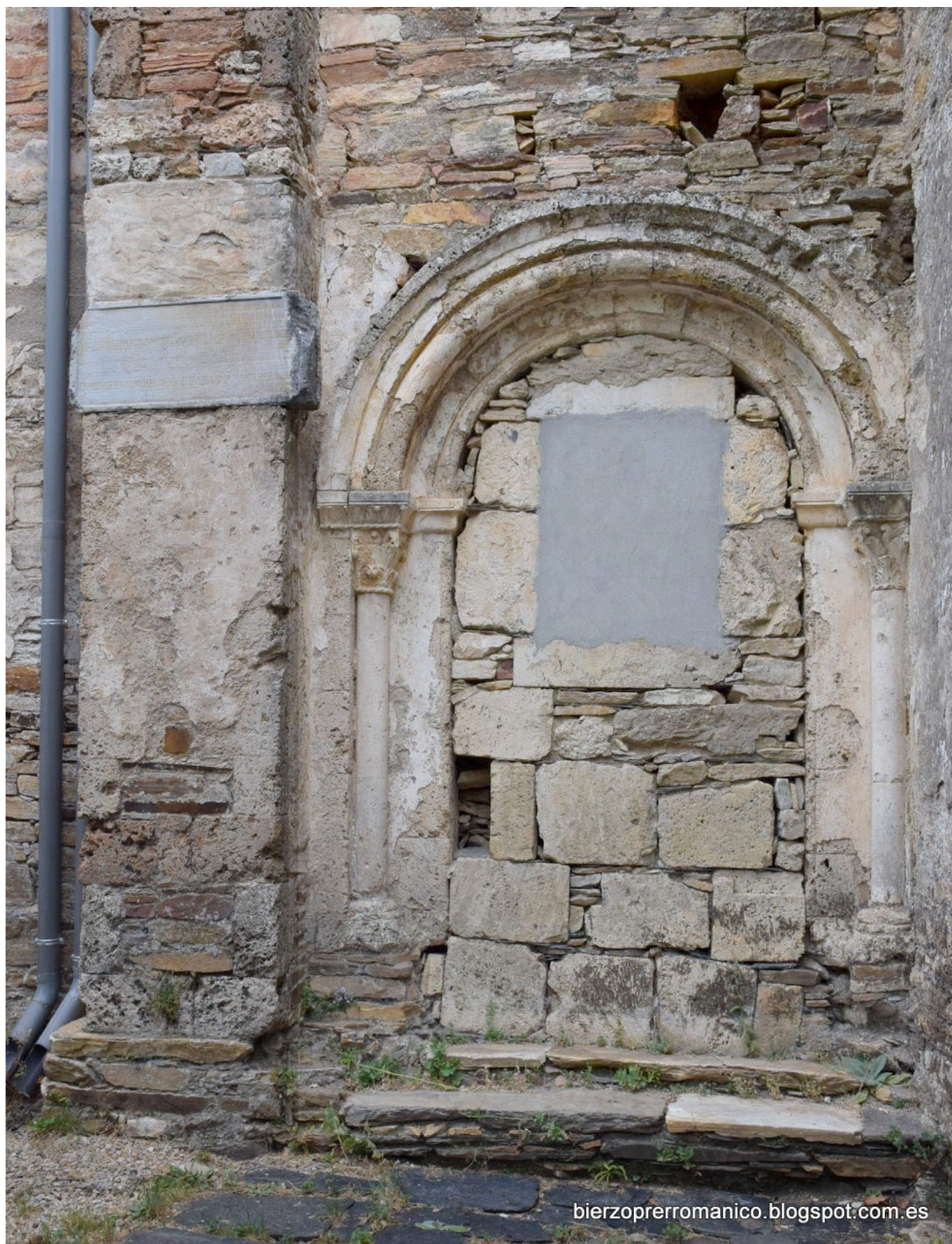
San Pedro de Montes - Puerta románica de salida al Claustro de los Arcos -