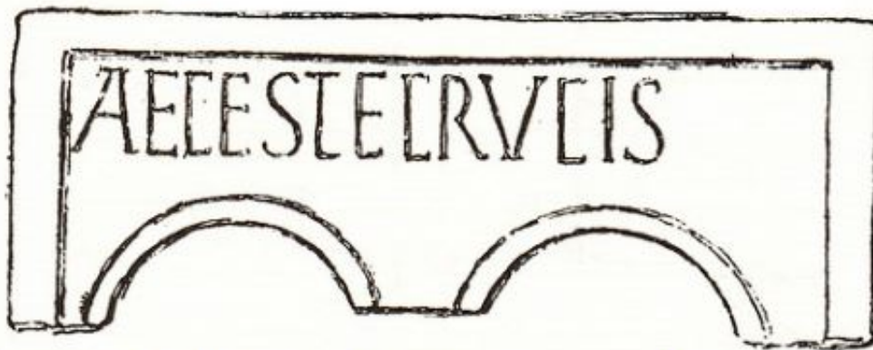
5. Dintel de ventana bifora y dibujo (según Gómez Moreno)