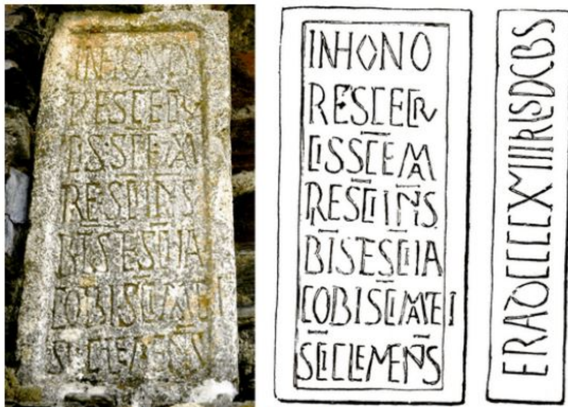
6. Epigrafe desaparecido y dibujo (según Gómez Moreno)