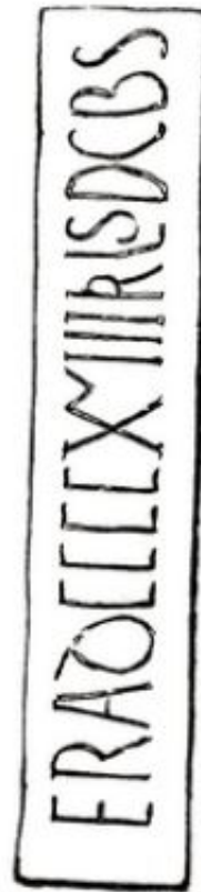
6. Epigrafe desaparecido y dibujo (según Gómez Moreno)