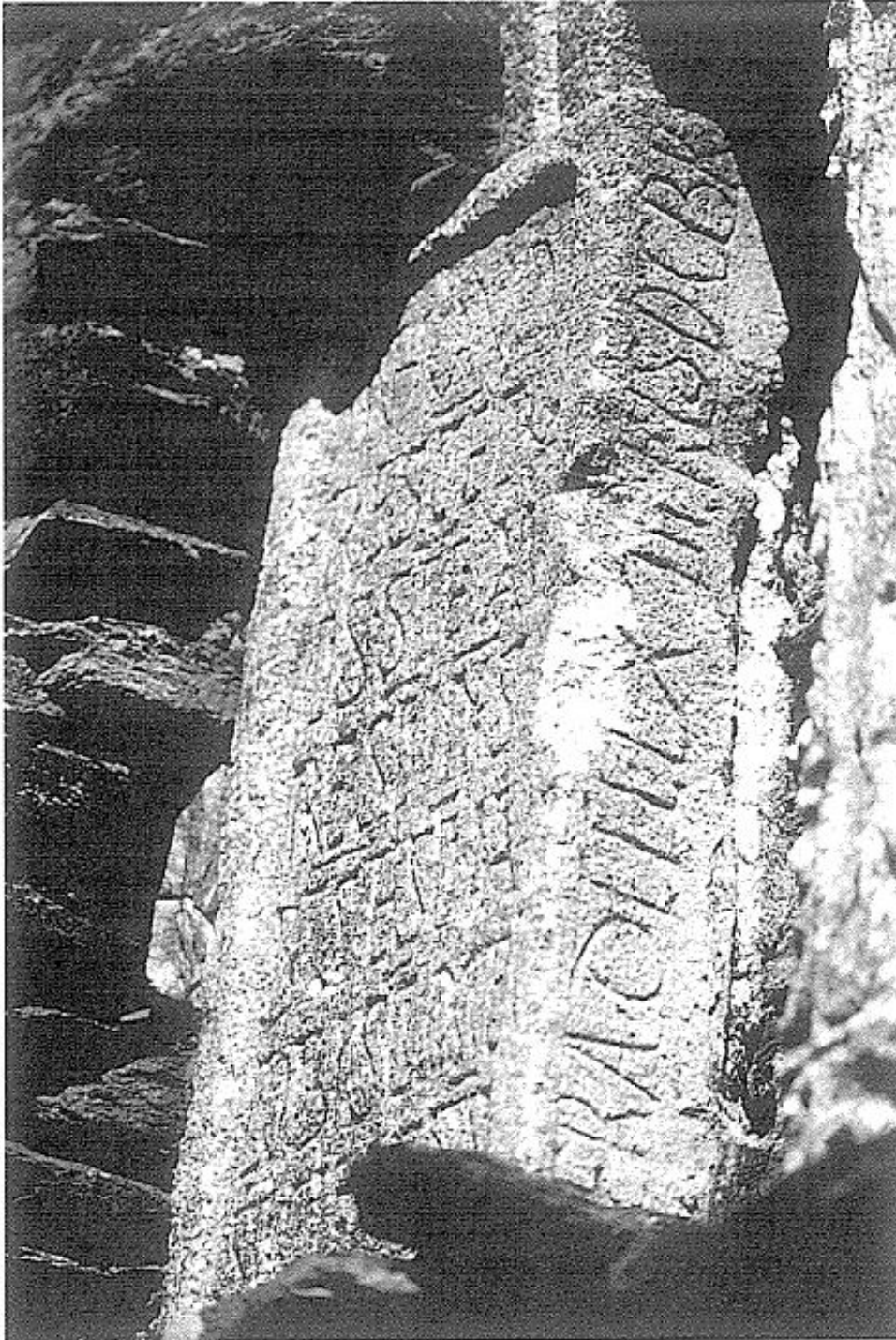
santa cruz artemio