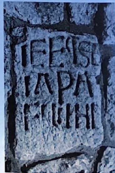
2 c. Consecratio de la iglesia de La Asunción de La Serna (Ap. nº 57).