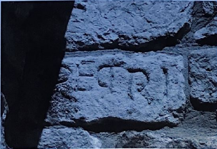
2 b. Consecratio de la iglesia de La Asunción de La Serna (Ap. nº 57).