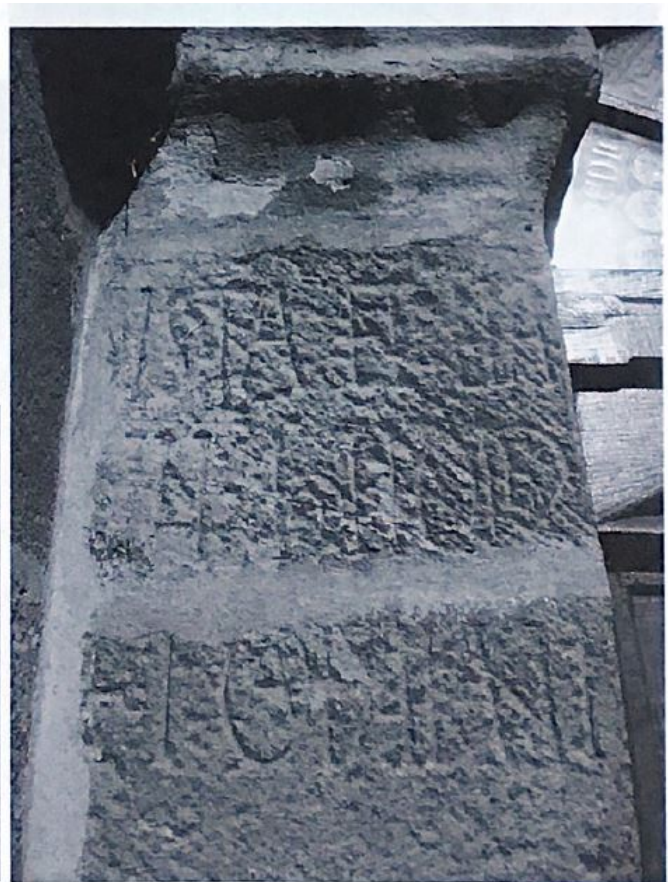
2 b. Consecratio de la iglesia de San Cosme y San Damián (Ap. nº 89).