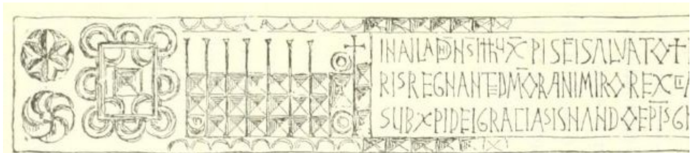
Fig. 72. San Adriano de Boñar: inscripción histórica de la igle