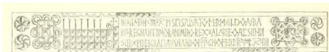
Fig. 73. San Adriano de Boñar: inscripción histórica de la iglesia de S. Salvador