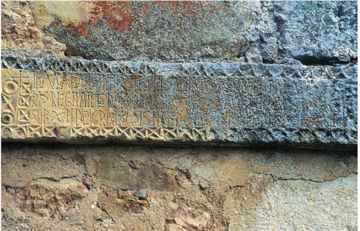
San Salvador. ER