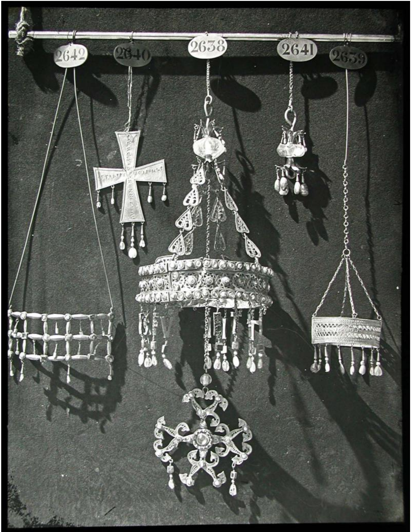
ΑΕΗΤΑΜ44. foto palacio