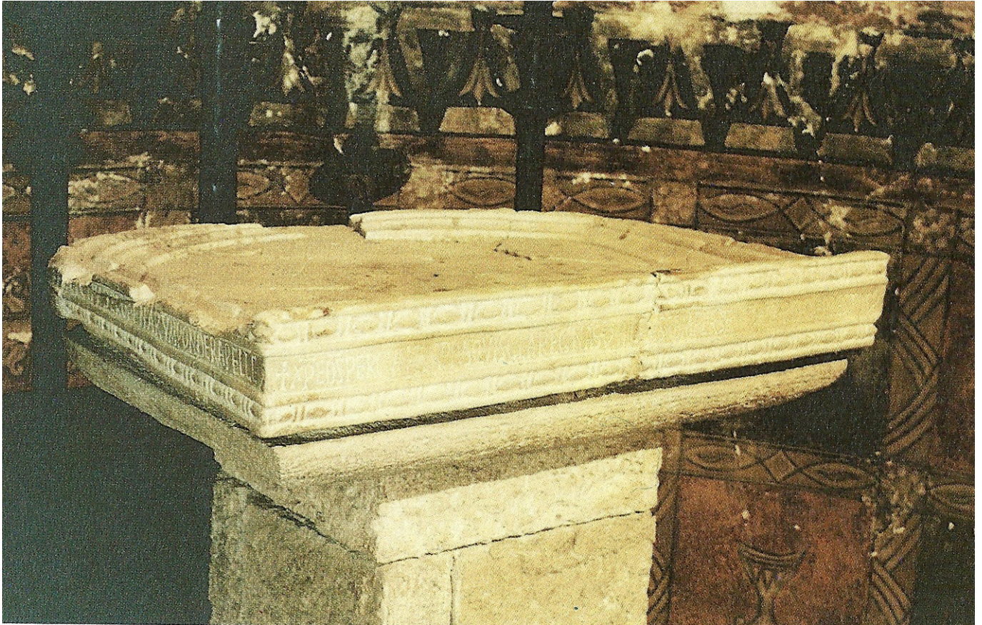
Sant Feliuet de Vilamilans