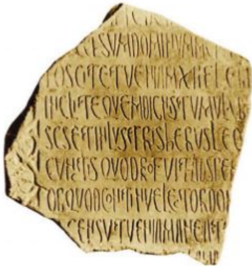
LÁM. XXXVI. Epitafio del obispo Leo? (Foto Museo de Málaga). [volver al texto]