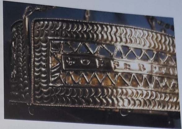
Láminas 166 y 167.

Dedicatoria del abad Teodosio en la franja central de la corona de lámina repujada, Palacio Real.