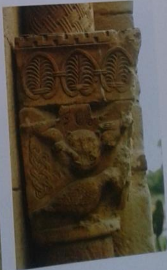
CatRom xviii, 357