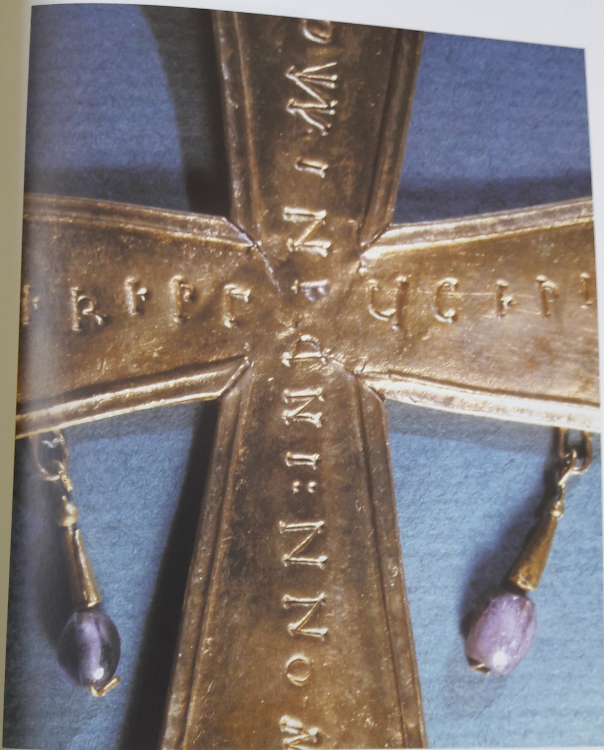
Lámina 101. Cruz de estructura laminar con dedicación de Lucecio, Palacio Real 2.640.