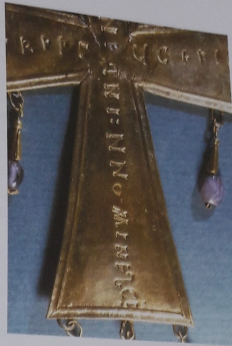
Láminas 177 y 178.

Tramos verticales, superior e inferior, de la dedicación en la cruz de Lucecio.