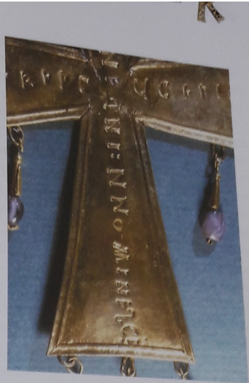
Láminas 177 y 178.

Tramos verticales, superior e inferior, de la dedicación en la cruz de Lucecio.