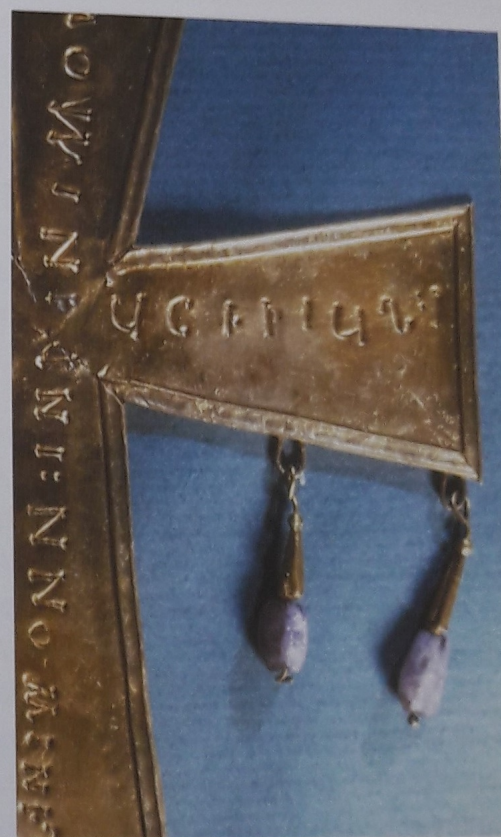
Láminas 179 y 180. Tramos horizontales, izquierda y derecha, de la dedicación en la cruz de Lucecio.