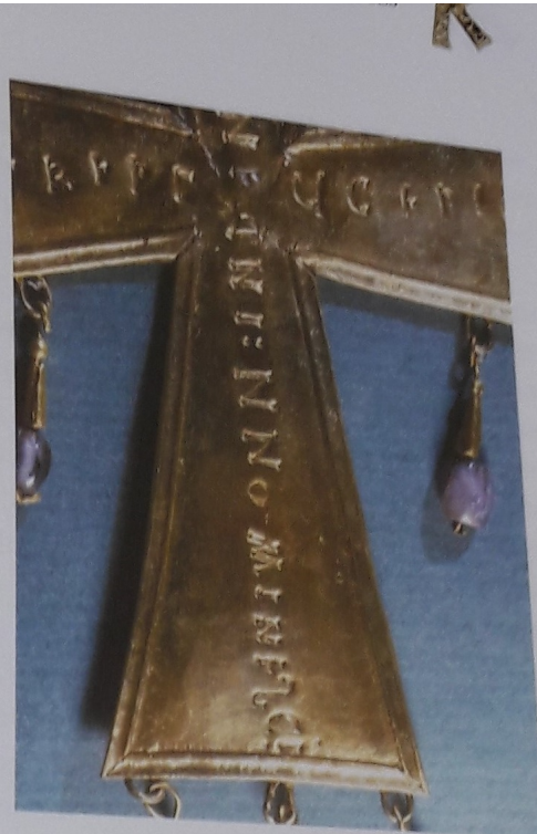
Láminas 177 y 178. Tramos verticales, superior e inferior, de la dedicación en la cruz de Lucecio.