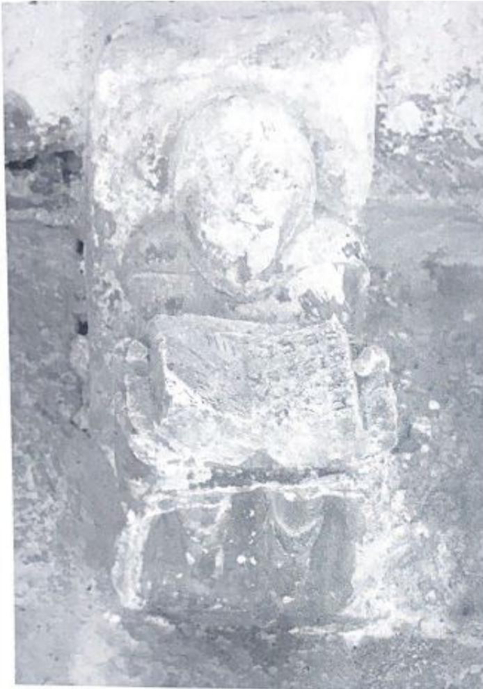
Fig. 9. Canecillo del pórtico de San Miguel, en San Esteban de Gormaz.