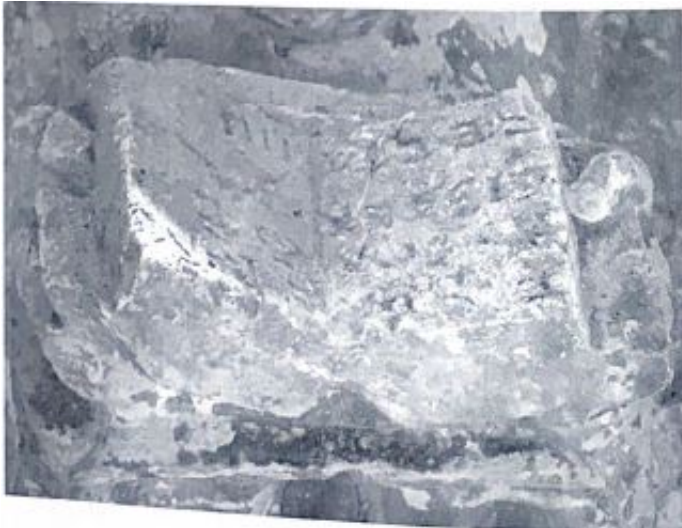
Fig. 10. Detalle del códice que sujeta el monje sobre sus rodillas.