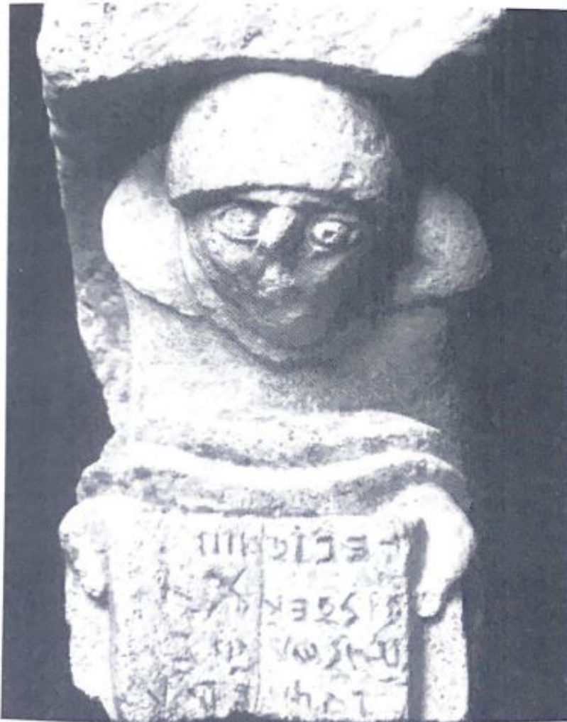
Fig. 13. Reproducción del canecillo de Soria Románica (2009).