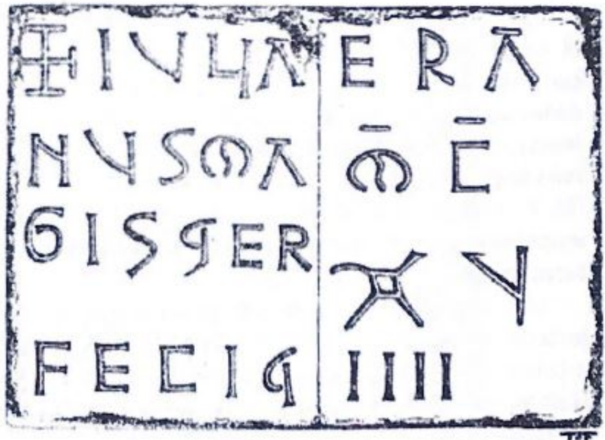
Fig. 12. Dibujo de la inscripción realizado por Teógenes Ortego (1957).