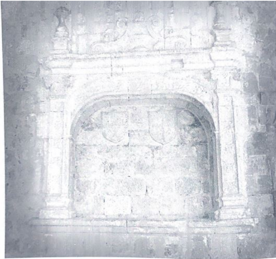
Fig. 15. Lucillo renacentista en el pórtico. La inscripción se encuentra entre los dos escudos heráldicos que hay en su interior.