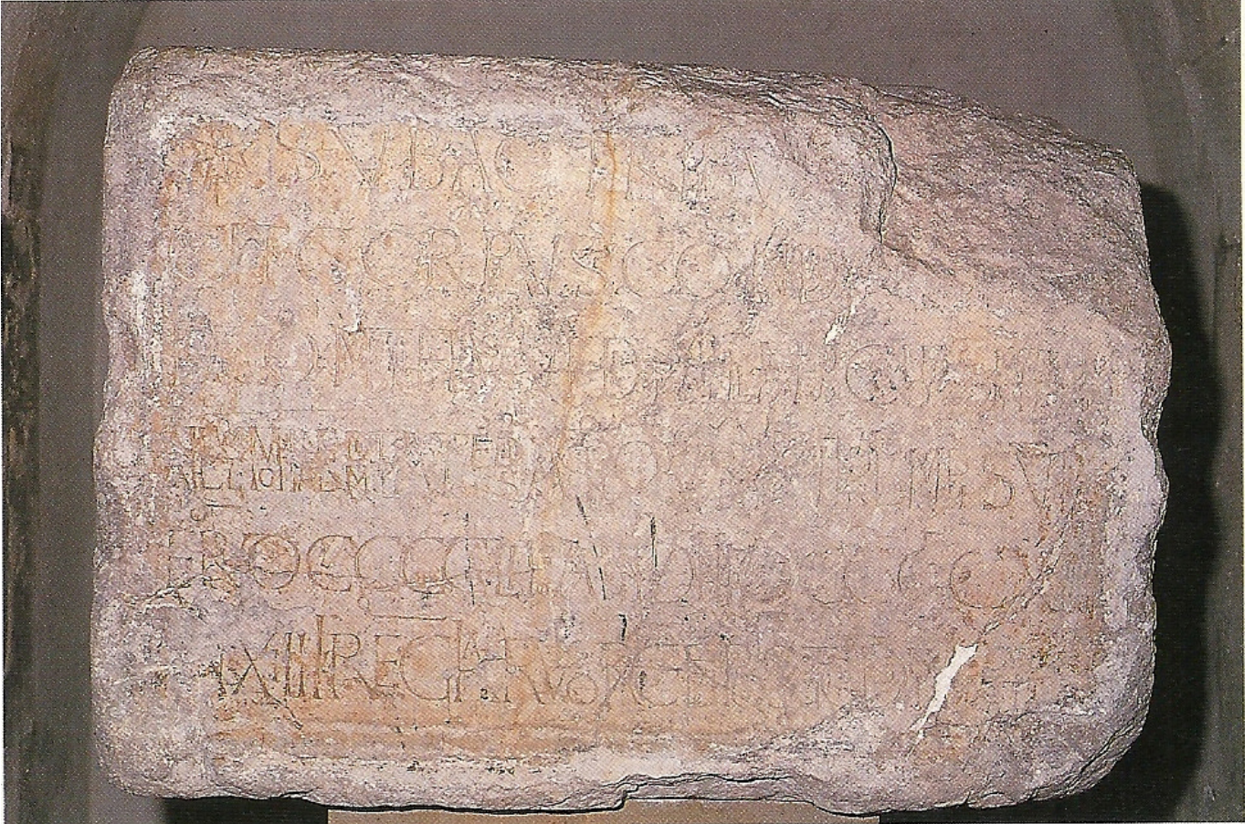
Sant Pau del Camp