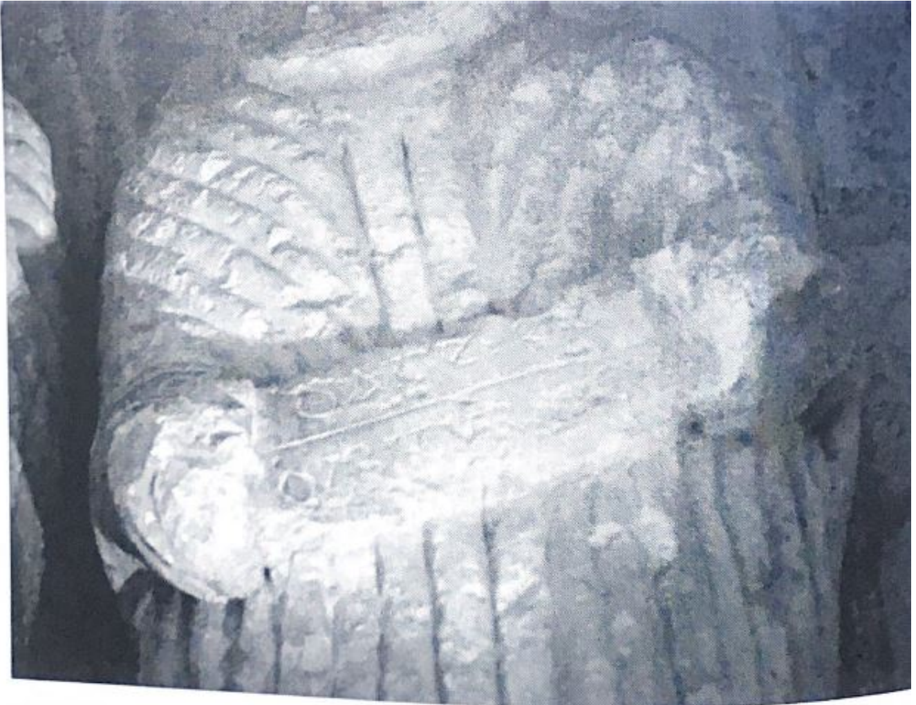
Fig. 22. Inscrici3n de la figura de la derecha.