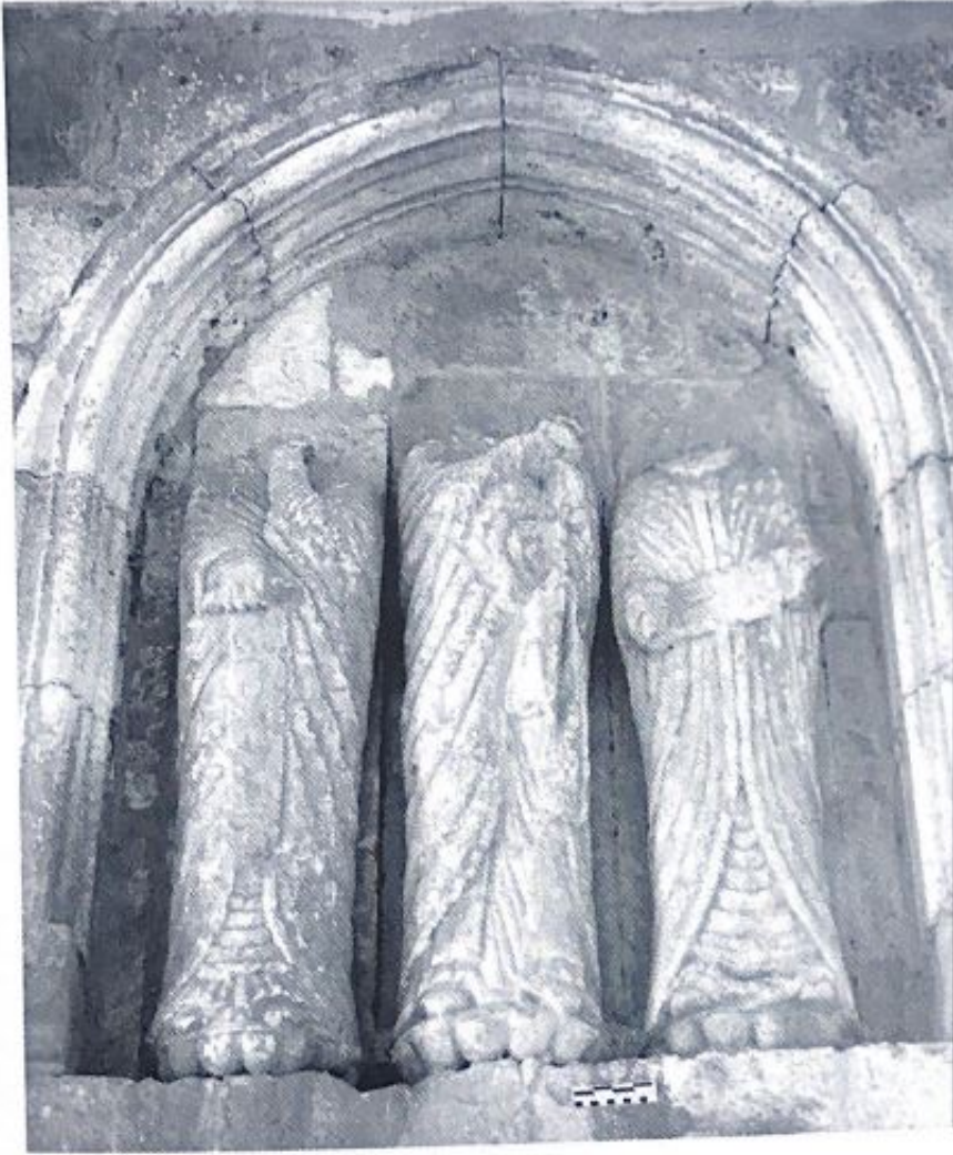
Fig. 18. Hornacina en el pórtico de Santa María de Tiermes.