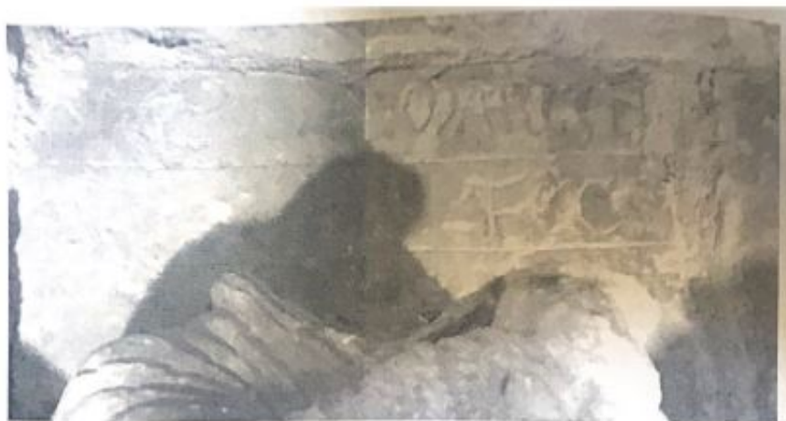
Fig. 24. Inscrici3n sobre la figura central. FALTA