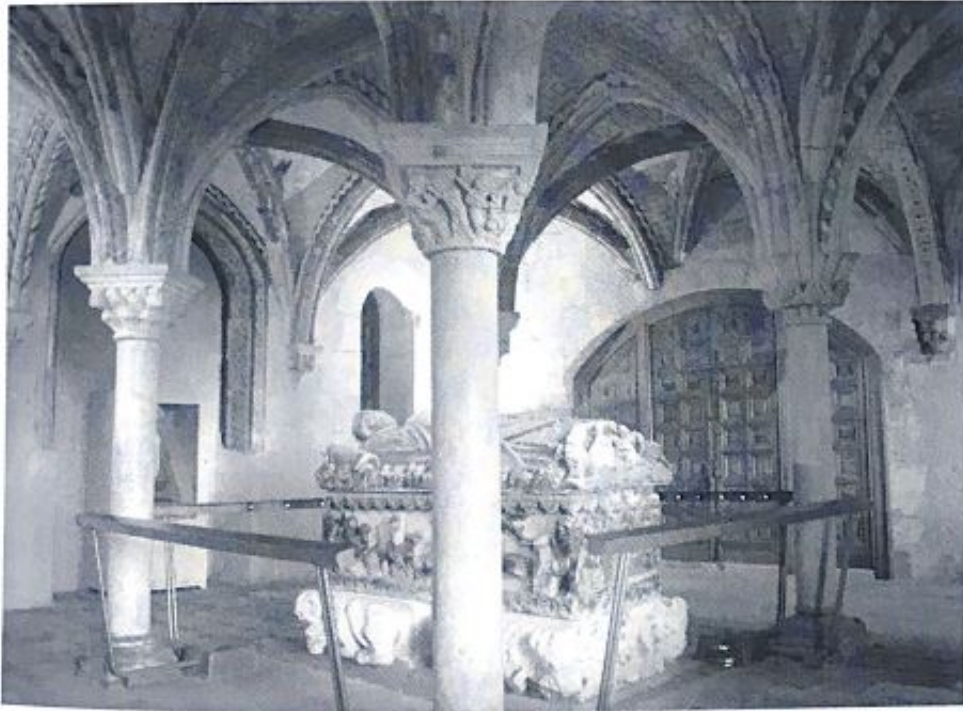
Fig. 32. Antigua sala capitular de la catedral de El Burgo de Osma. En el centro, el sepulcro de S. Pedro de Osma. En la columna de la izquierda se pueden apreciar las inscripciones 8 y 9.