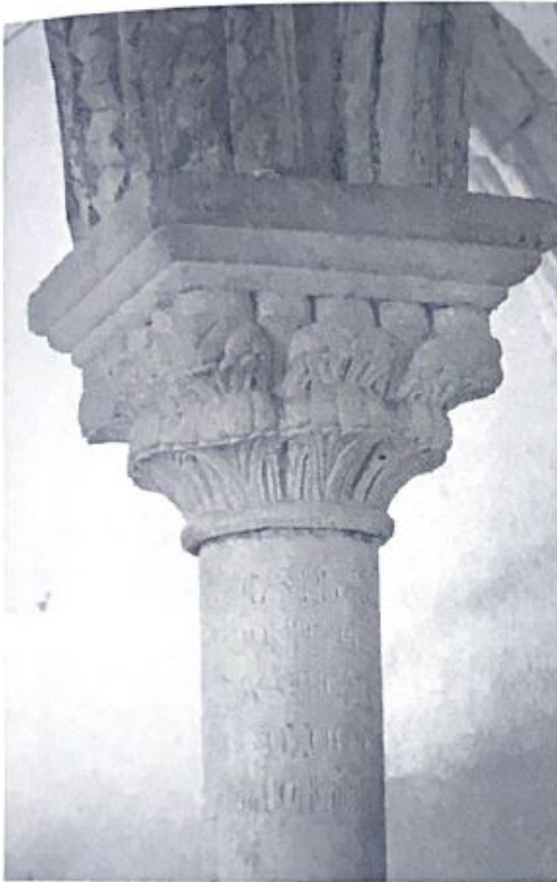
Fig. 33. Primera inscripción de la columna de la sala capitular.