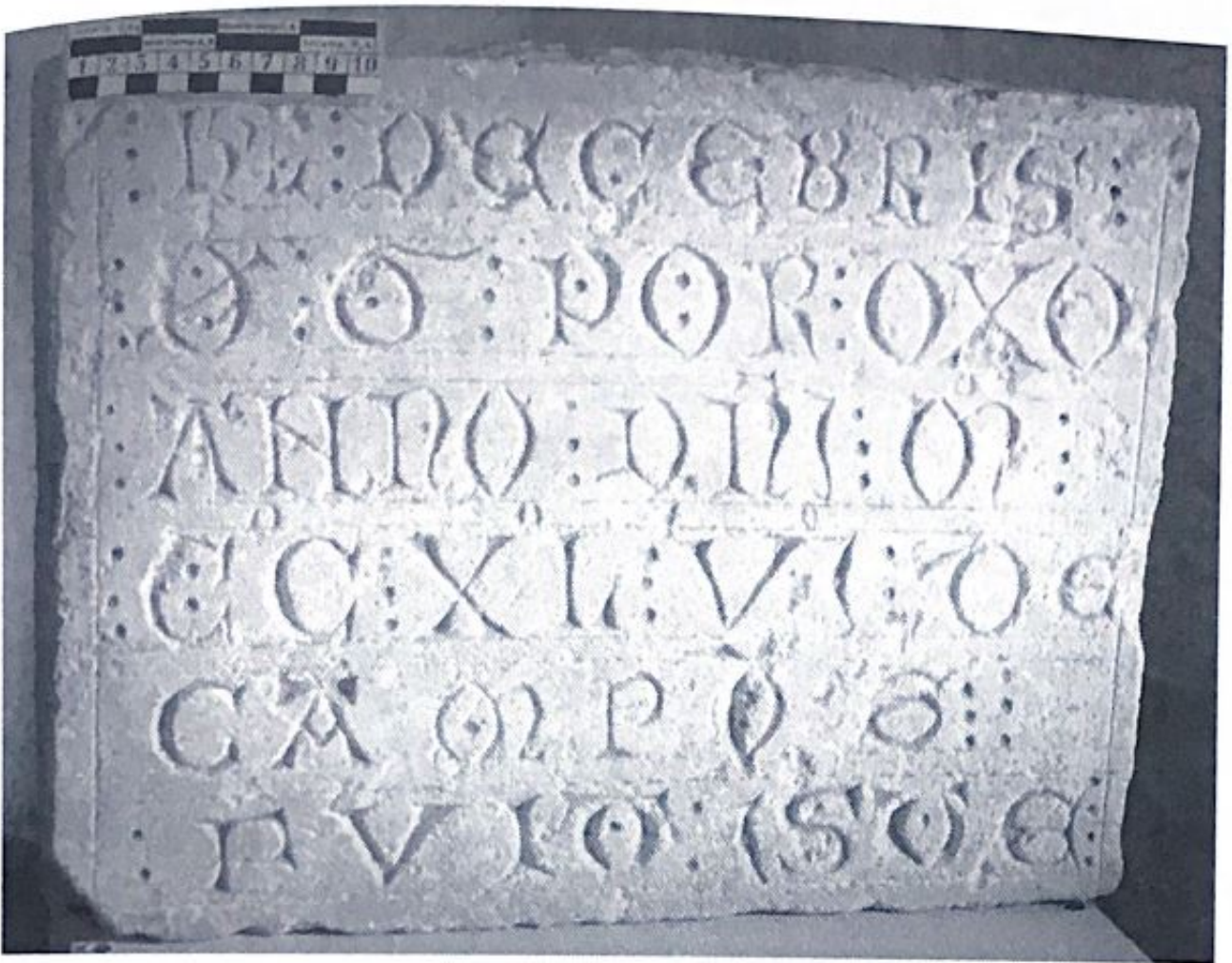
Fig. 47. Inscripción de un prior oxomense