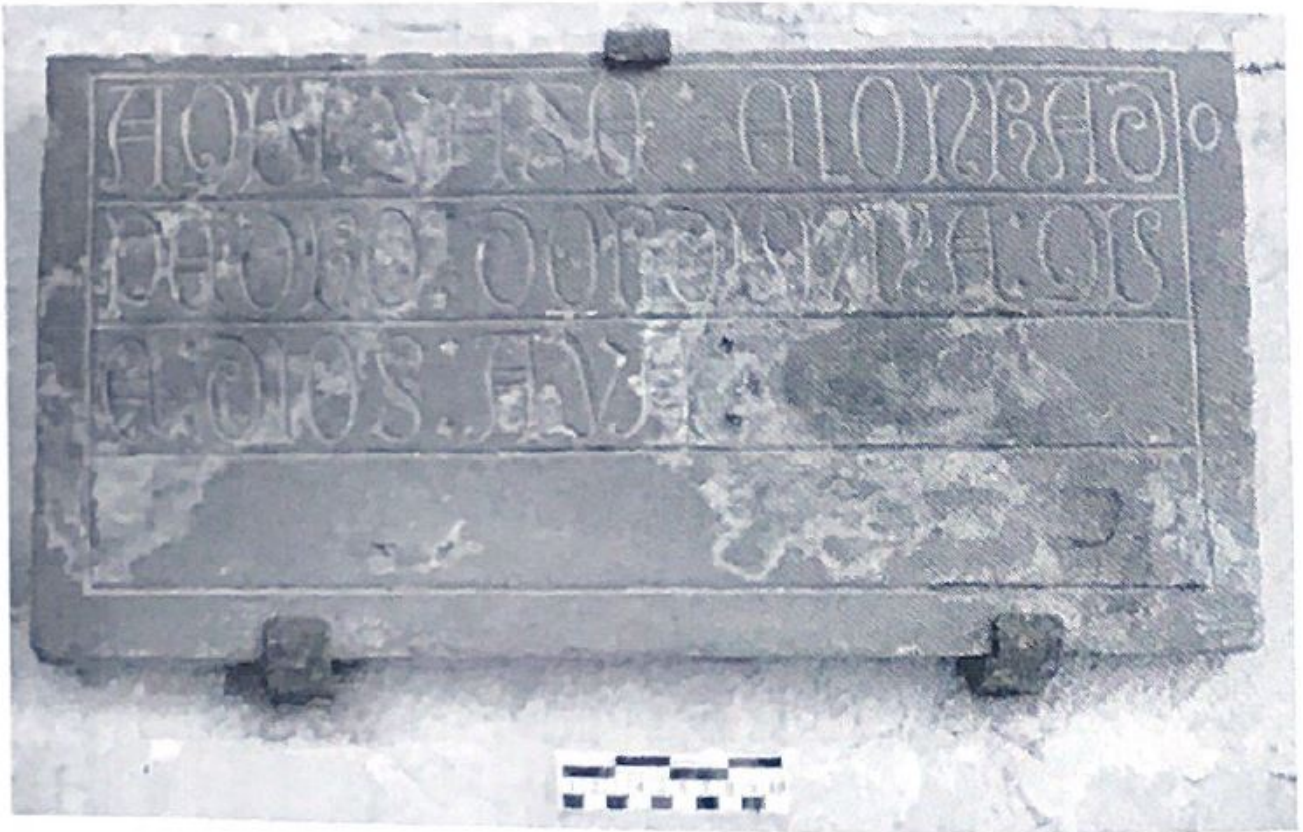
Fig. 57. Inscripción sepulcral de Pedro de Orduña.