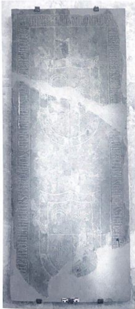
Fig. 59. Inscripción sepulcral de Per