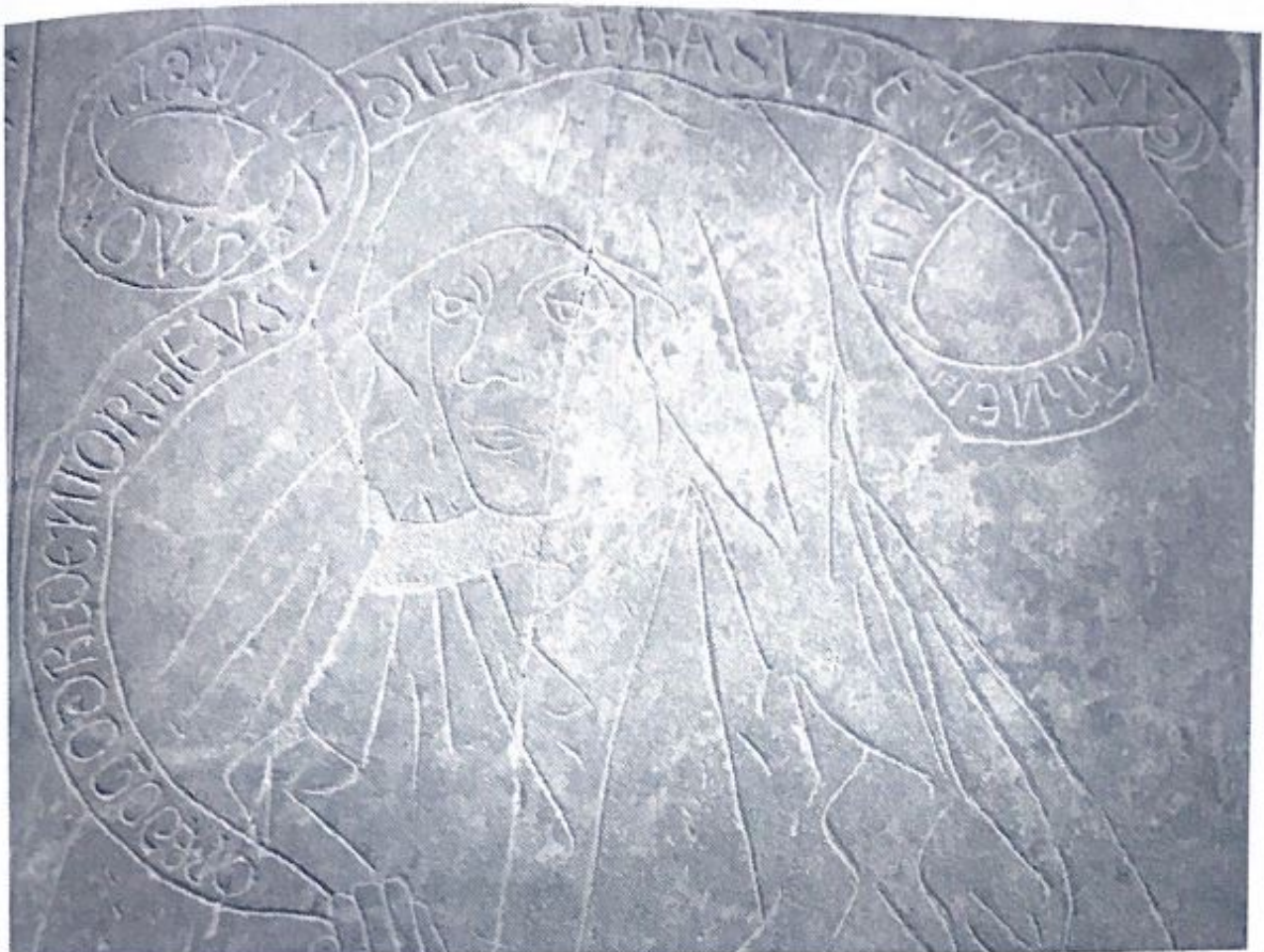
Fig. 63. Detalle de la filacteria sobre la cabeza de la difunta.