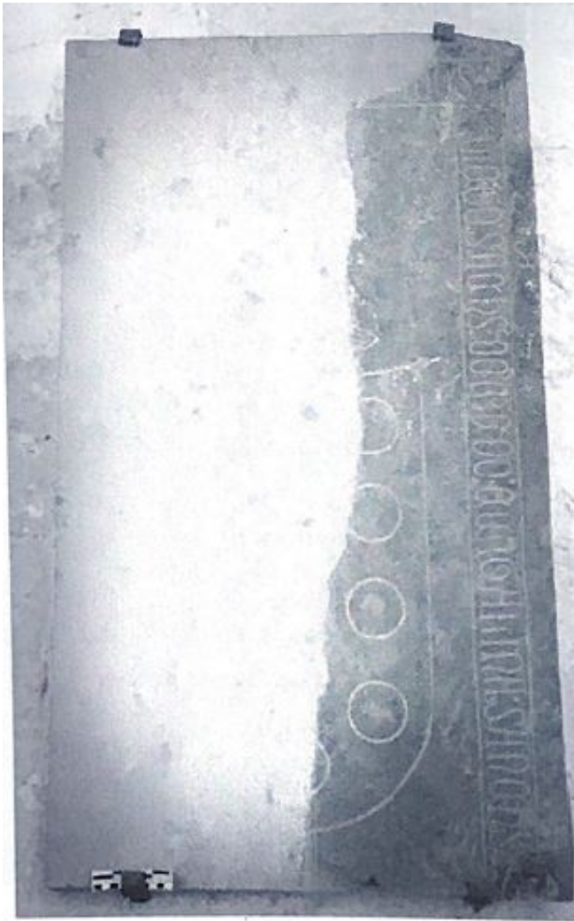
Fig. 69. Inscripción de Diego Sanches y su esposa Catalina.