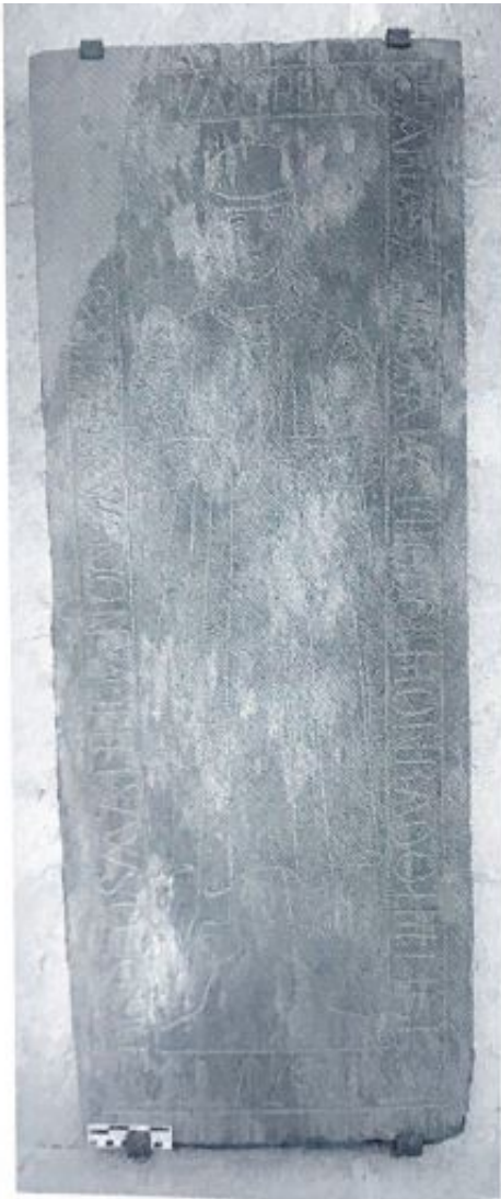
Fig. 71. Inscripción de Pedro de Arlasa.